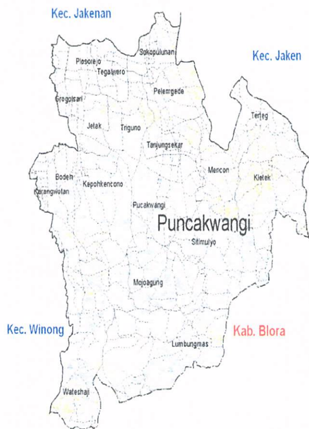
Peta Kecamatan Pucakwangi

Luas Kecamatan Pucakwangi ± 12.283.000 ha dan secara administratif Kecamatan Pucakwangi terdiri dari 20 (dua puluh) desa dengan jumlah penduduk ± 47.934 jiwa.